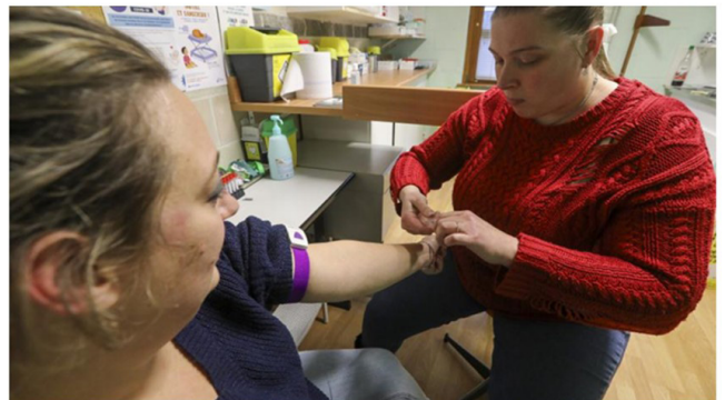
Une équipe de six infirmières au centre social Marlière-Croix Rouge accueille ou se déplace à domicile pour dispenser tous types de soins.

Des infirmières rémunérées non pas à l'acte, mais au temps passé, selon les besoins du patient. C'est la méthode testée, avec succès, au centre de soins infirmiers du centre social Marlière Croix-Rouge. en lien avec l'association Soignons humain.